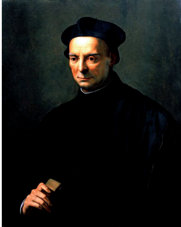
RIDOLFO DEL GHIRLANDAIO, Ritratto di Niccolò Machiavelli (ante 1527). Londra, Collezione privata.